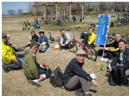
【渡良瀬ミーティング会場での昼食風景】

「春の県民サイクリング」は、地元を走る基本に立ち返って、誰もが気軽に参加できる易しい企画とする予定です。どうぞお楽しみに。