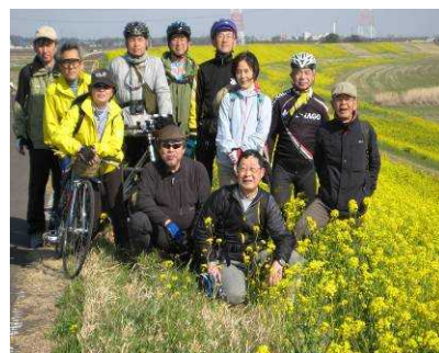
【菜の花が一面に咲く利根川堤で】